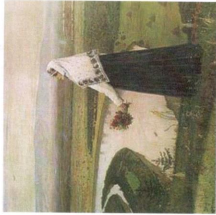
Рис. 2. Нестеров Н.П. «На горах»