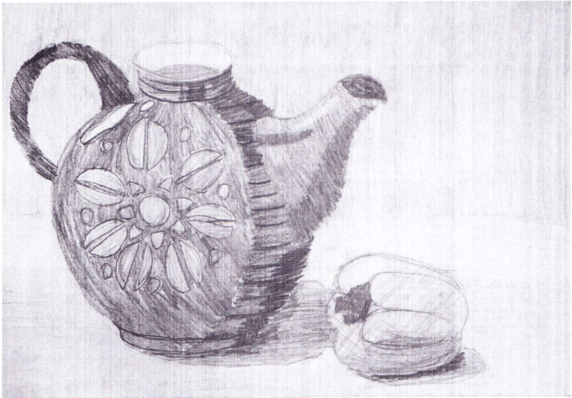
Образец работы на 8 баллов