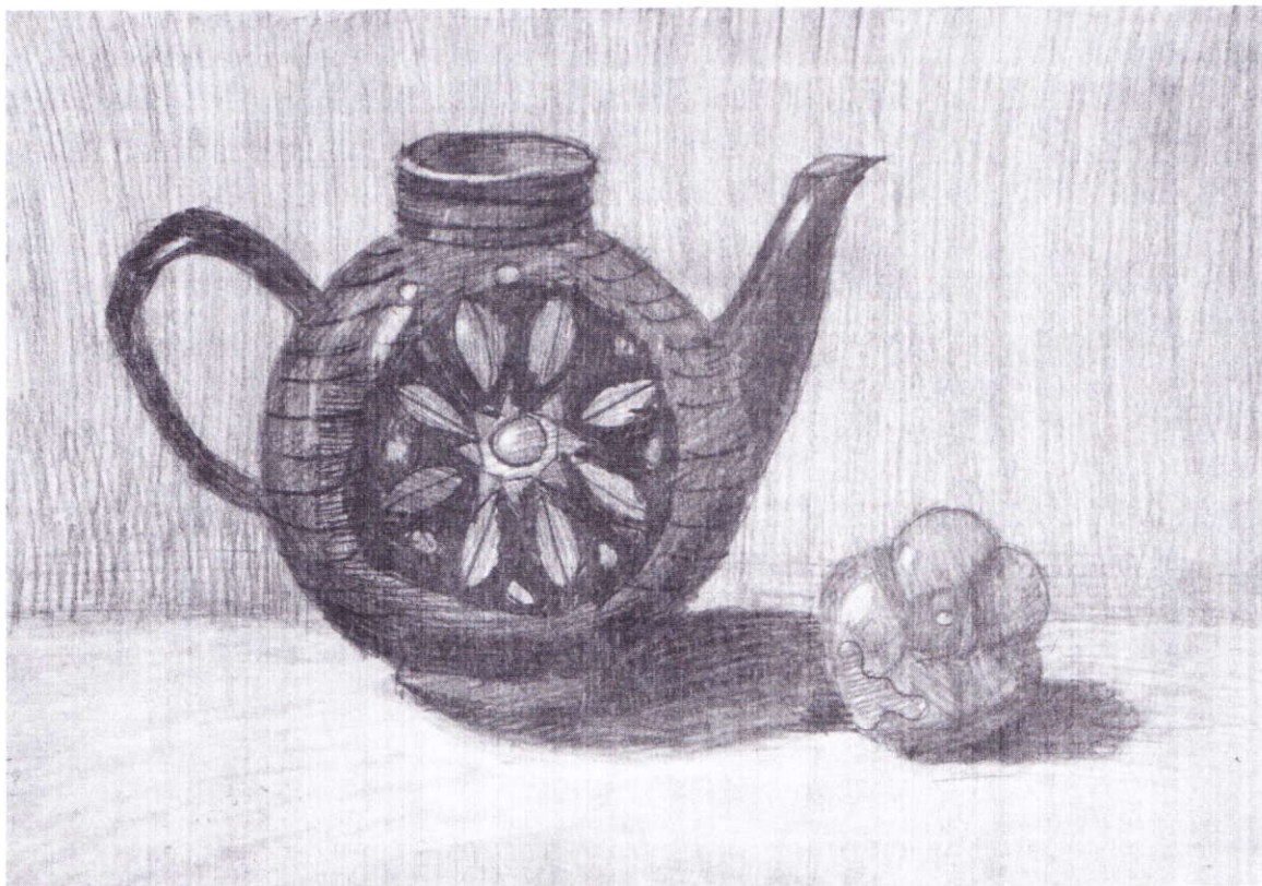
Образец работы на 10 баллов