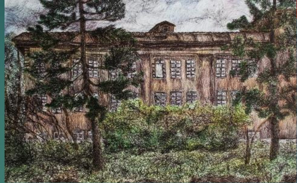
Гирс Арина. Военный госпиталь. Этюд