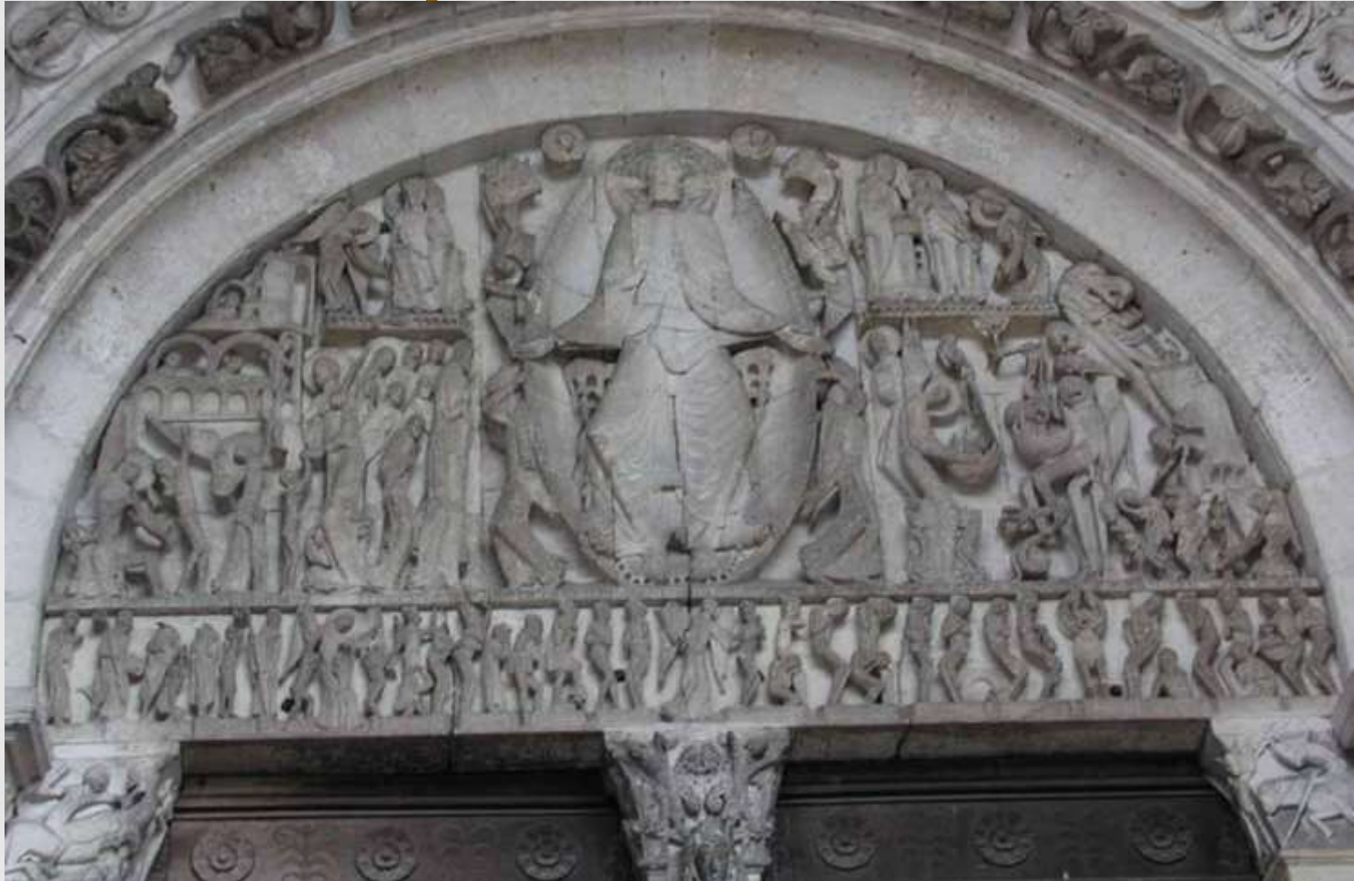
Западный фасад церкви Сен-Лазар, Франция